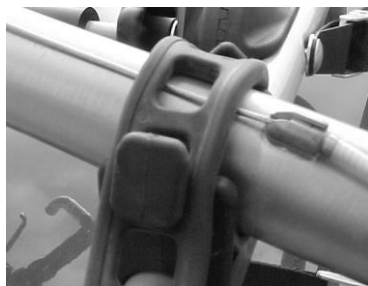
Fig. 4a Not Recommended