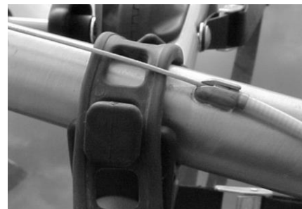
Fig. 4b Recommended

6. Attach the rubber straps to the rubber cradles per Fig. 3. Start with the round (end) hole of the strap stretched over the diamond shaped anchor on the cradle. After the bike is mounted, attach one of the square holes on the strap to the front anchor so that the strap fits snug over the bike frame. Check to make certain that all straps are attached correctly before proceeding. Be sure not to route straps over any cables (see Fig. 4a.), but rather under them (see Fig. 4b). This will protect the bike's finish.